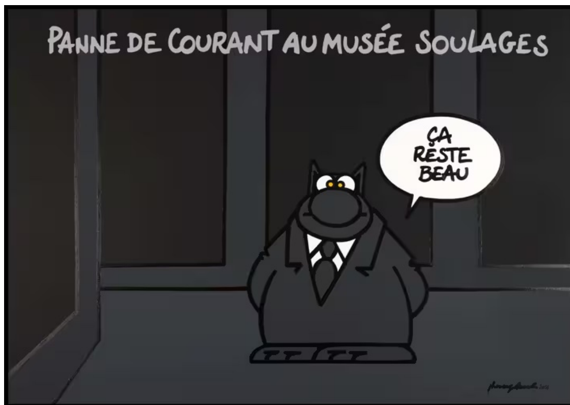
De Geluck, auteur belge des BD Le Chat

Soulages, peintre particulièrement connu pour son usage des reflets de la lumière sur les états de surface du noir qu'il appellera l'outrenoir.