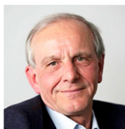
A. KAHN, Médecin, généticien et essayiste